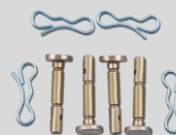
Set de 4 vis de sécurité et goupilles Réf. : 7011-M6-0010