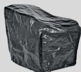
Housse de protection Réf. : 2024-U1-0005