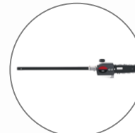
Elagueuse sur perche